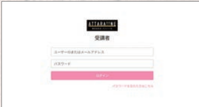
DX講習 LMSログイン画面

LMSでは、学習状況が一覧できるレポート画面や、レポートをPDFとして出力する機能が備わっています。