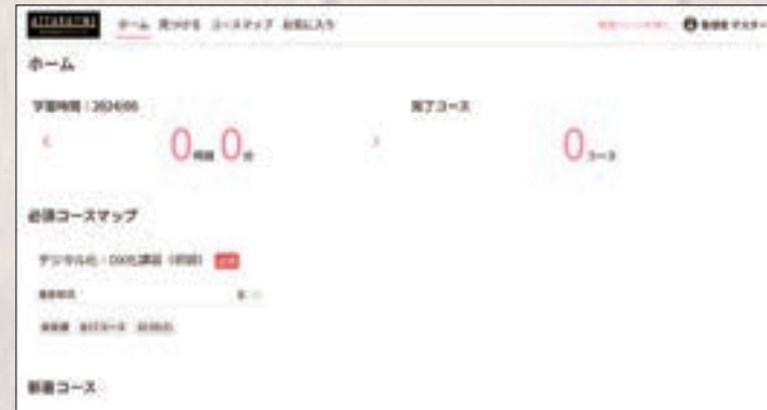
DX講習 LMS ダッシュボード