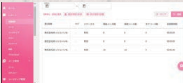
DX講習 LMSレポート画面